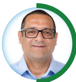
VEREADOR Ribeirinho PSD