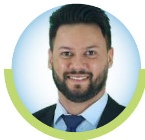
VEREADOR Lei UNIÃO BRASIL