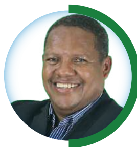
VEREADOR Renato Machado UNIÃO BRASIL